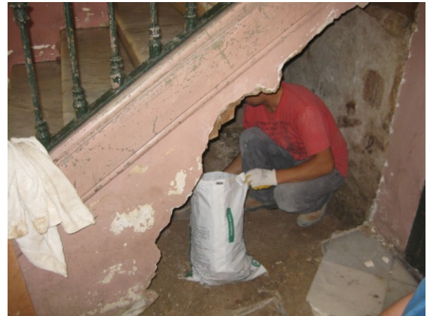
FOTO 2. Treballs manuals del fossat