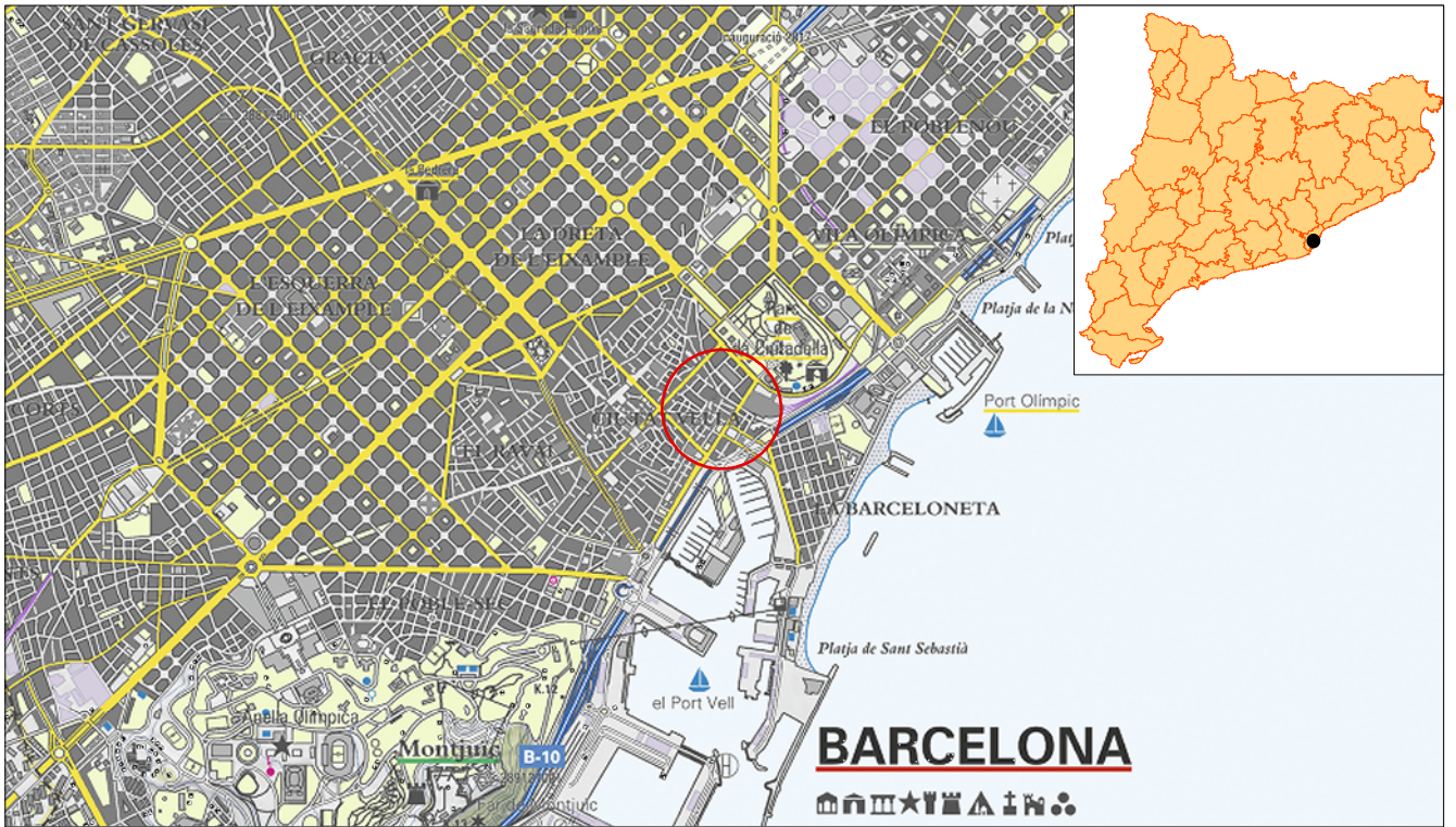
Mapa topogràfic 1:50.000