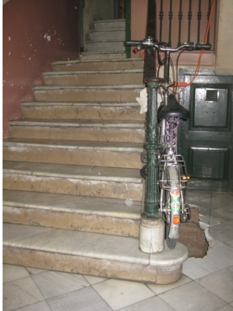
FOTO 1. Vista general de la zona intervinguda