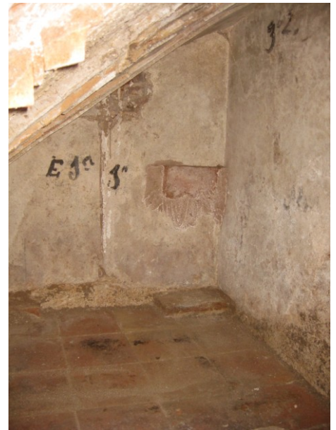
FOTO 4. Detall del paviment UE 04