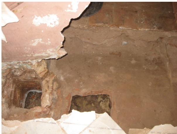
FOTO 3. Detall de la coberta de la fossa sèptica i l'arqueta de registre